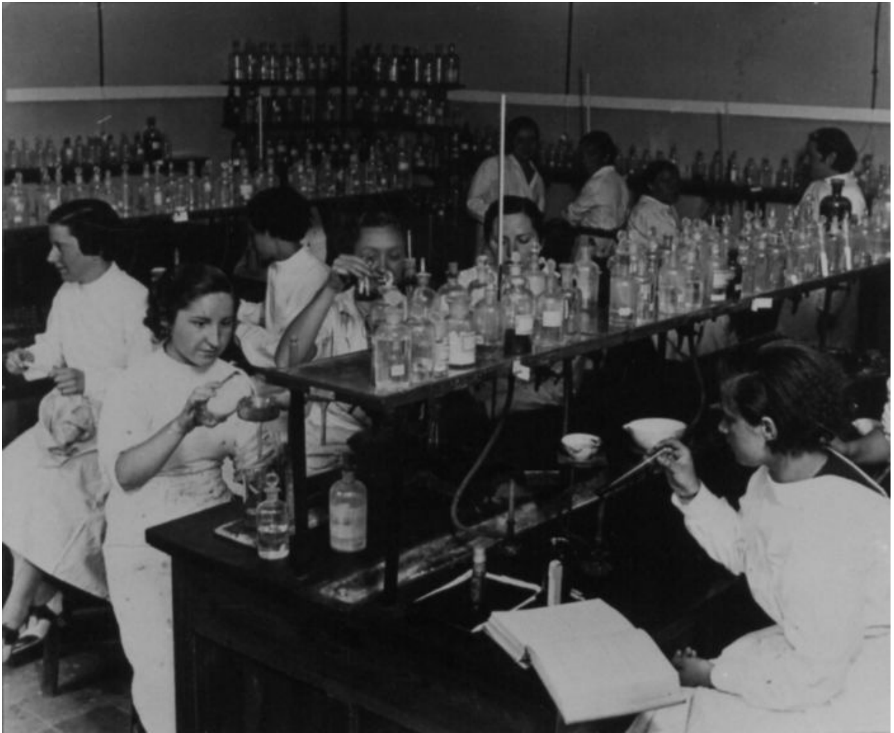
El Laboratorio Foster de la Residencia de Señoritas, hacia 1930. Instituto Internacional, Madrid.