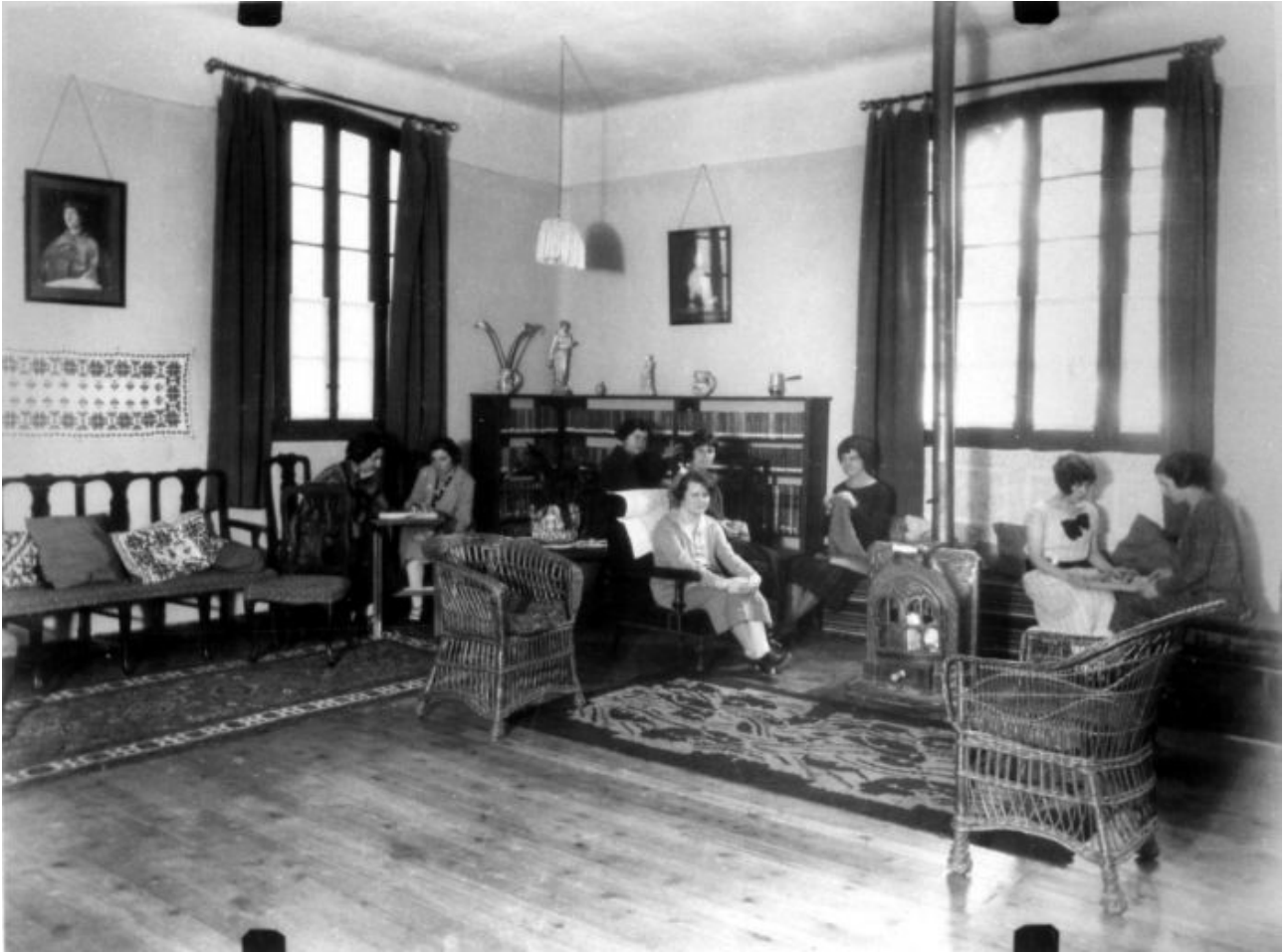
El salón de la Residencia de Señoritas en su sede de la calle de Fortuny, 30, Madrid, hacia 1923.