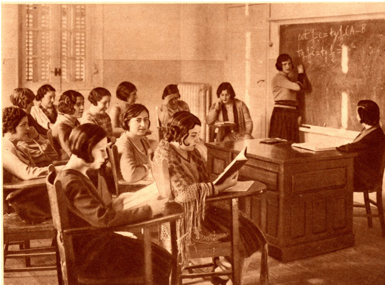
Una clase de Matemáticas en la Residencia de Señoritas. Fotografía publicada en la revista Crónica , 2 de marzo de 1930.