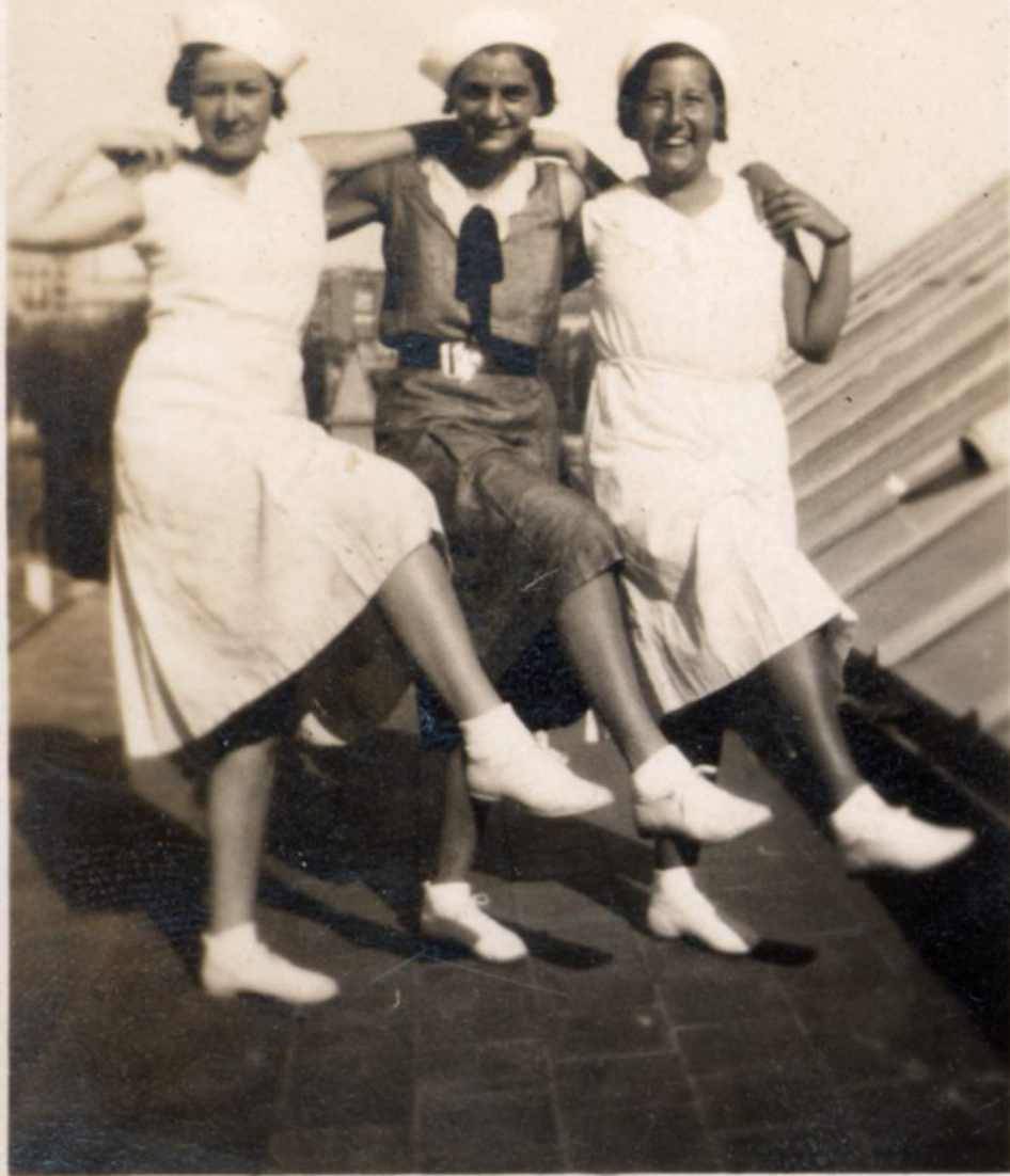
Residentes en el tejado de la Residencia de Señoritas, curso 1930-1931.