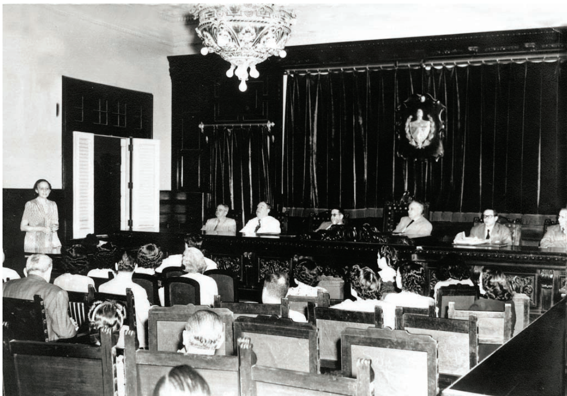
María Zambrano impartiendo una conferencia en el Paraninfo de la Universidad de Río Piedras, Puerto Rico, 1942. Copia de época.